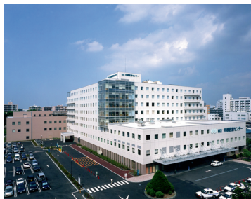
病院長 / 磯部 宏

診療科目 内科、呼吸器内科、消化器内科、循環器内科、神経内科、代謝・内分泌・糖尿病内科、腫瘍内科、精神科、緩和ケア内科、外科、消化器外科、呼吸器外科、乳腺外科、小児外科、腫瘍外科、人工透析外科、内分泌外科、小児科、整形外科、婦人科、眼科、皮膚科、麻酔科、耳鼻咽喉科、泌尿器科、脳神経外科、脳神経・内分泌外科、心臓血管外科、心臓外科、血管外科、放射線科、放射線診断科、リハビリテーション科、病理診断科、救急科、臨床検査科